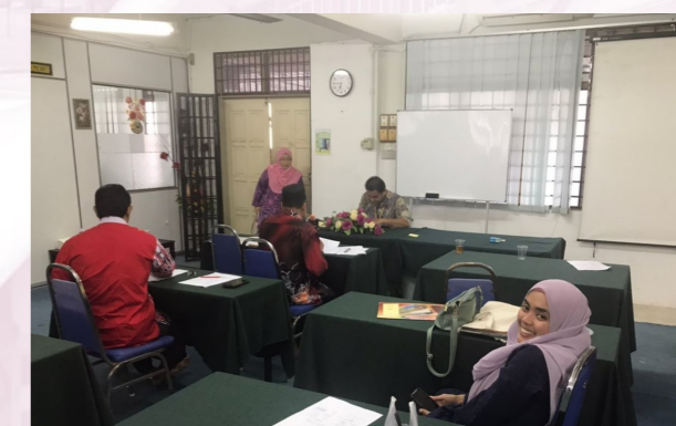
Di Bilik UPP 2 pada : 16 - 17 November 2022