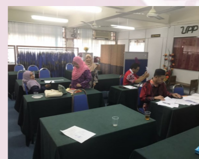
Semak Silang Antara Jabatan