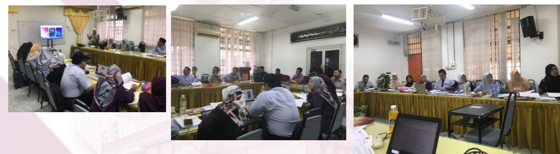
Kursus Pemantapan Kualiti Pentaksiran